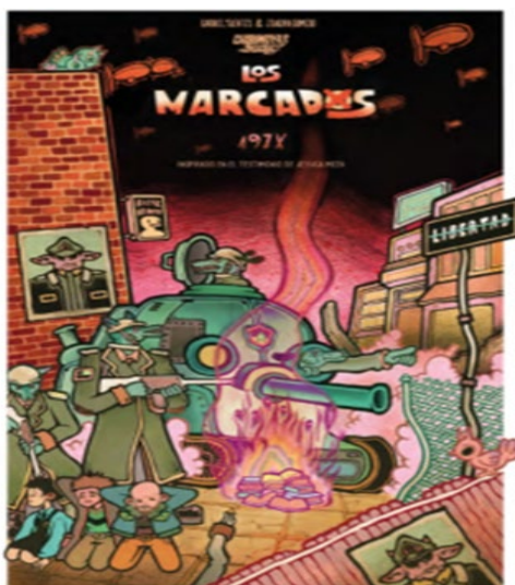
Imagen 1. Narrativa gráfica Los Marcados