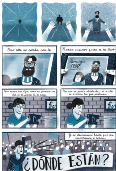
Imagen 10. Narrativa gráfica La salida