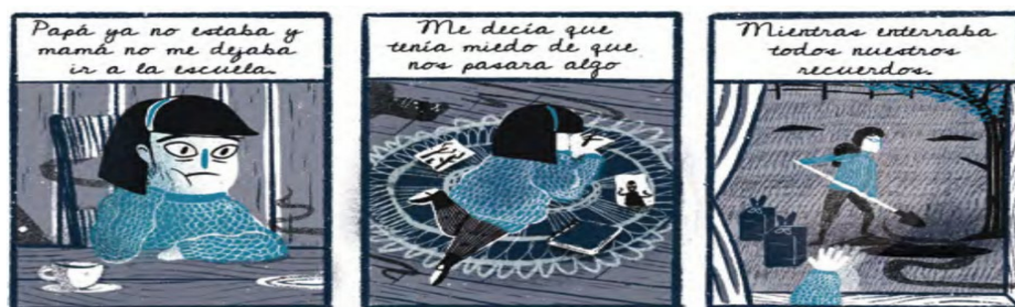
Imagen 8. Narrativa gráfica La salida

Al mundo onírico mostrado en esta página, le sigue una imagen de hechos reales en la vida de Sofía (ver Imagen 8).