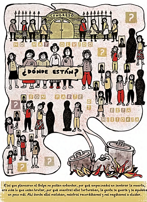
Imagen 5. Narrativa gráfica Olla común

inscrito de estima social de tenacidad (“coraje”, “lucha”, “resistencia”). Este espíritu de lucha se observa también en la imagen 5, con la que se cierra esta narrativa gráfica.