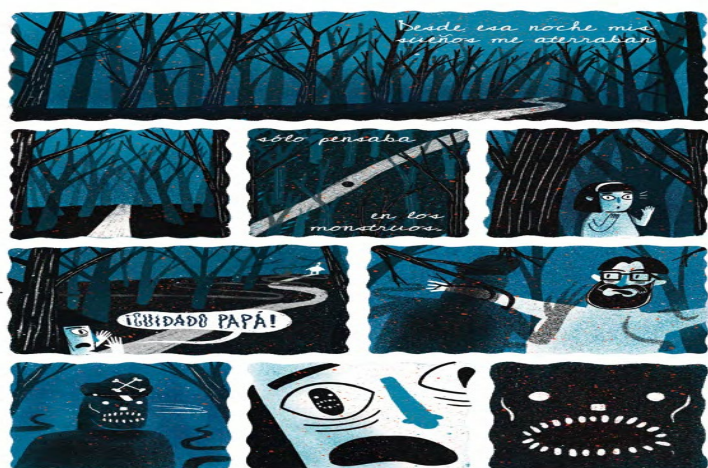
Imagen 7. Narrativa gráfica La salida

En la cuarta viñeta, se observa la imagen hiperbólica y elíptica del ojo asombrado de Sofía frente a lo expresado por su mamá y a los sentimientos de la progenitora ante la situación reinante. La niña evalúa dicho sentir, como se percibe en el siguiente ejemplo: “(12) Pero sé que tenía miedo , mucho miedo ” (énfasis nuestro). La hija realiza su evaluación a través de un afecto negativo, inscrito de inseguridad (“miedo”), graduado por fuerza, intensificación (“mucho”). Este miedo se apodera de Sofía, situación que se aprecia en la Imagen 7.