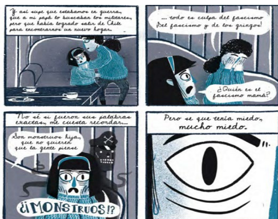
Imagen 6. Narrativa gráfica La salida