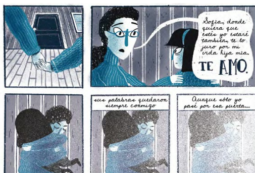
Imagen 9. Narrativa gráfica La salida

Ahora bien, el título La salida obedece a la única opción que la madre y sus vecinos encontraron para salvar a la niña: un salvoconducto para enviarla al extranjero. Sofia evalúa los sentimientos generados por esta situación, como se ve en los ejemplos siguientes: