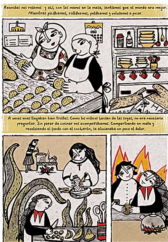
Imagen 4. Narrativa gráfica Olla común

El ambiente oscuro, con la presencia de los helicópteros (símbolos de la Fuerza Aérea en el golpe) y de los hombres que apuntan, mostrados a larga distancia y sin rasgos detectables, evidencian el ocultamiento del responsable de la violación de los derechos humanos. Sin embargo, la Imagen 4 ilustra una situación contraria a la primera. Veamos: