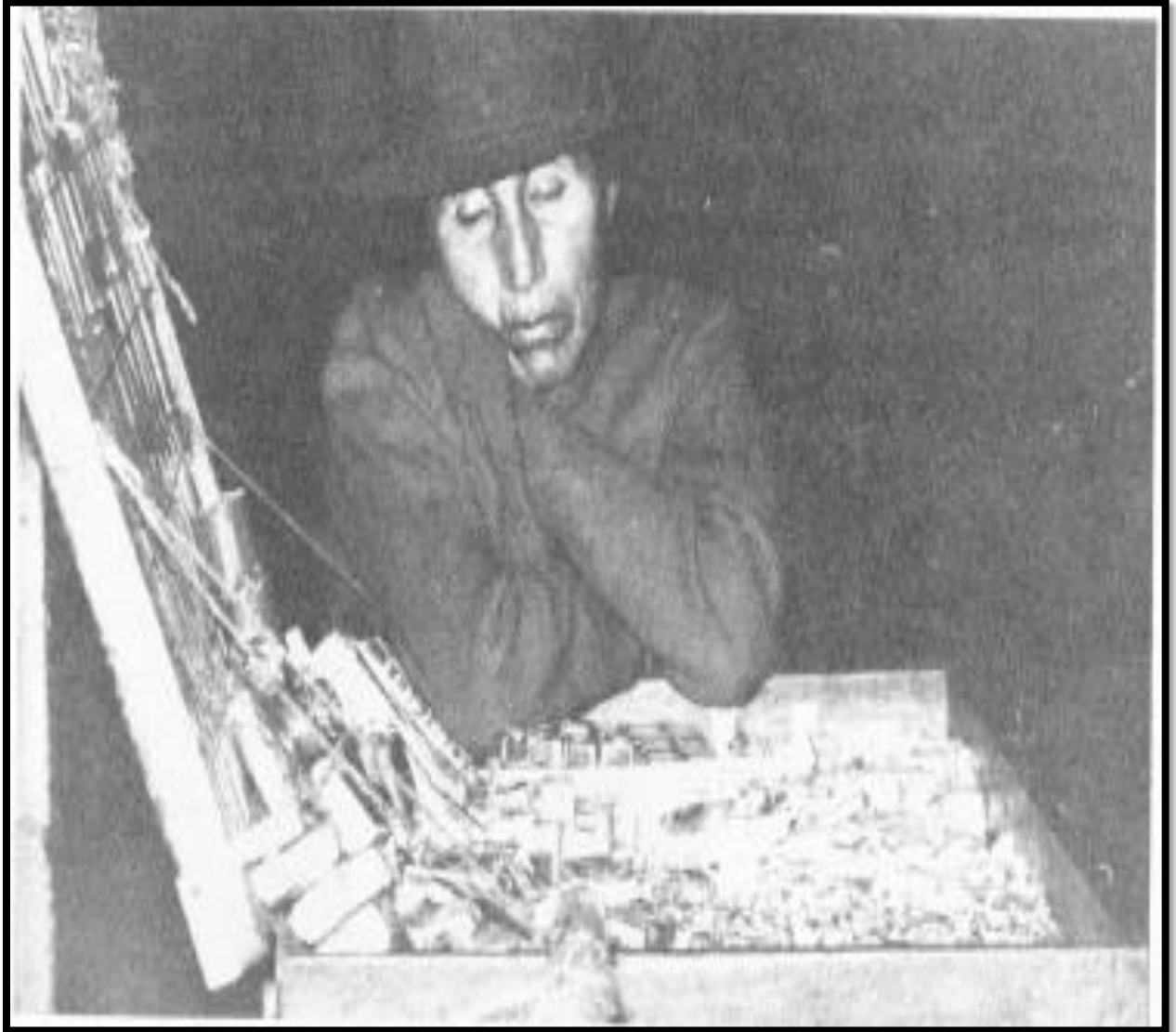
Fotografía 2.4 (1986).