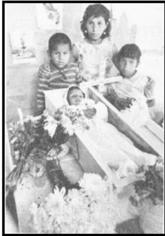
Fotografía 3.15 (1986).