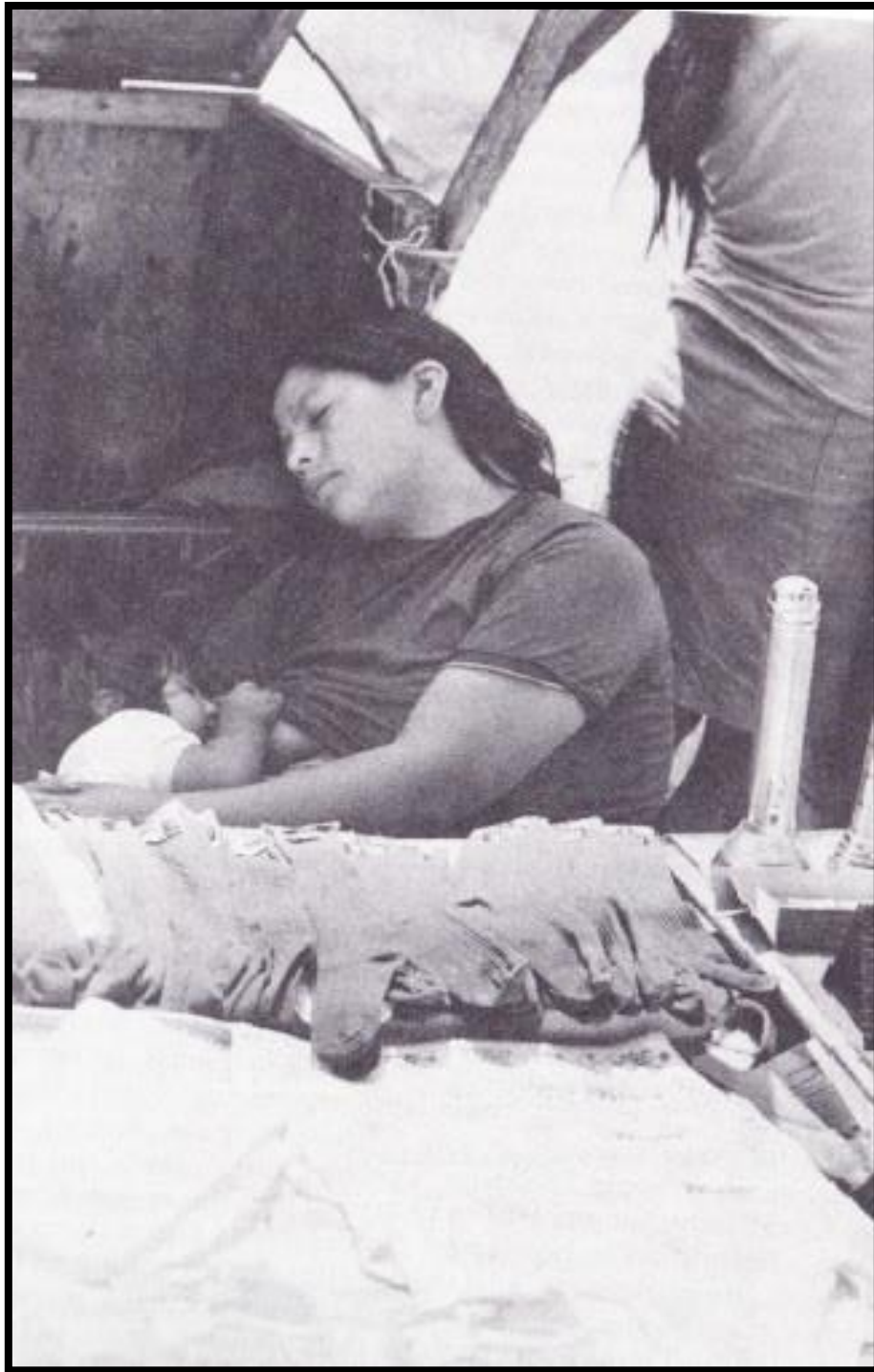
Fotografía 2.21 (1986).