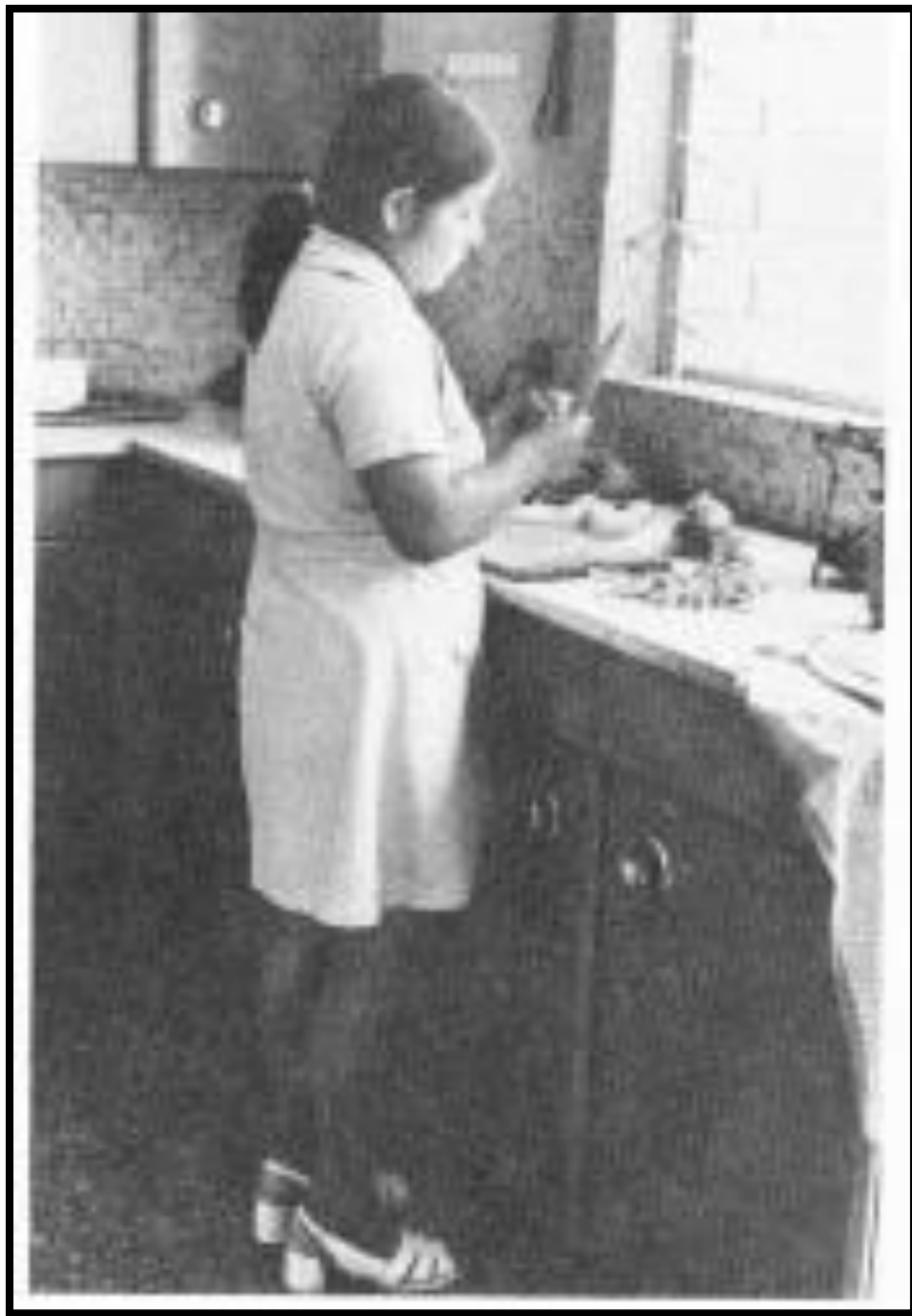
Fotografía 1.5 (1986).