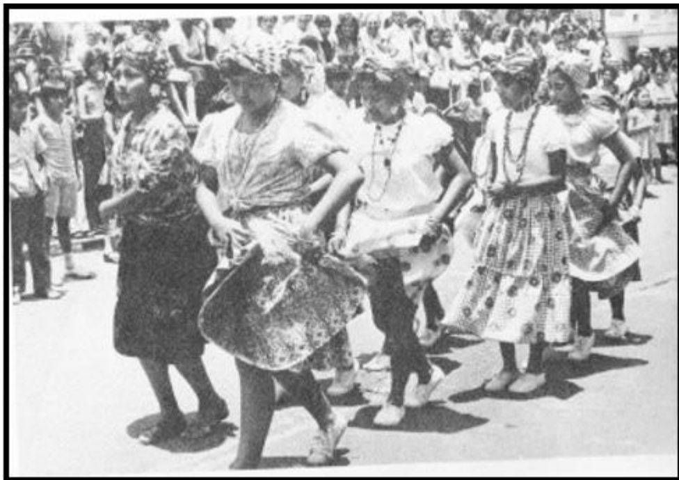
Fotografía 3.14 (1986).