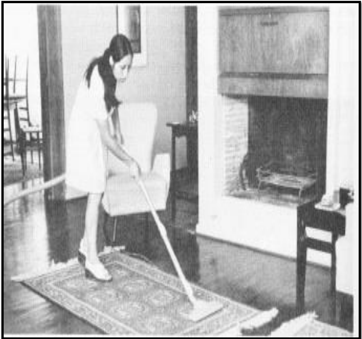
Fotografía 1.4 (1986).

menudeo y en la mayoría de casos a proveedores informales también. Estas trabajadoras están registradas por el municipio y deben pagar el derecho del uso de la calle, realidad que puede