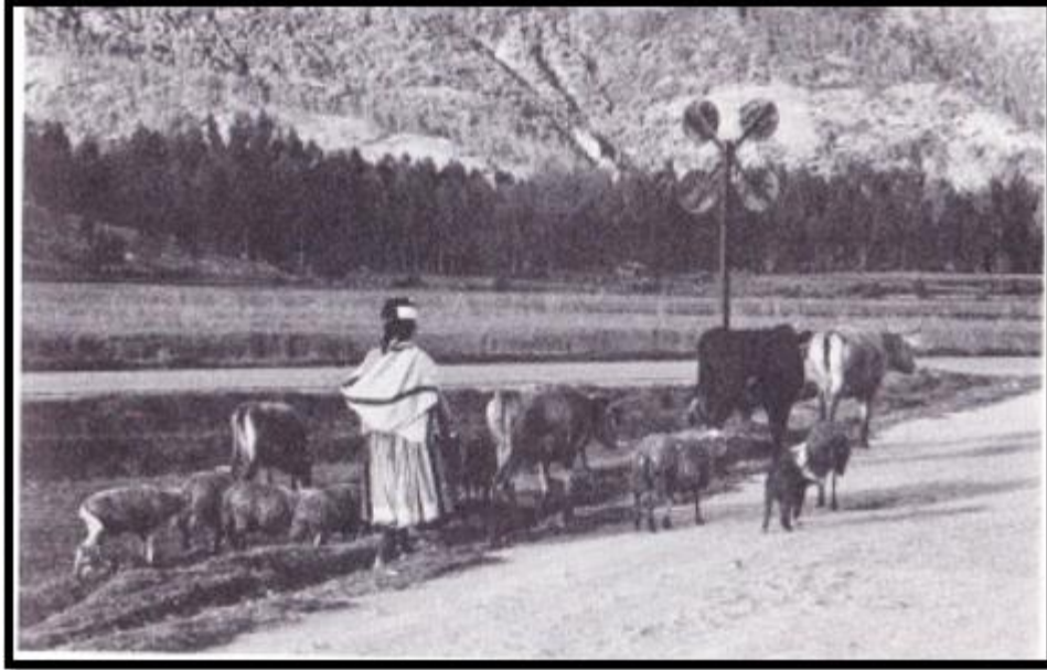
Fotografía 1.1 (1986).